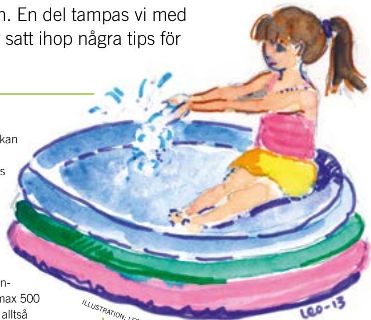
ILLUSTRATION: LEONORE NORDIN

FÖR ATT SPARA på miljön och skapa tryggare områden har vi därför beslutat att endast tillåta pooler på max 500 liter. Mindre pooler är alltså fortfarande tillåtna!