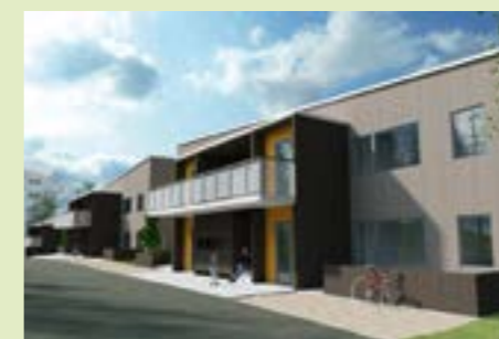
De nya husen rymmer sammanlagt 37 lägenheter.