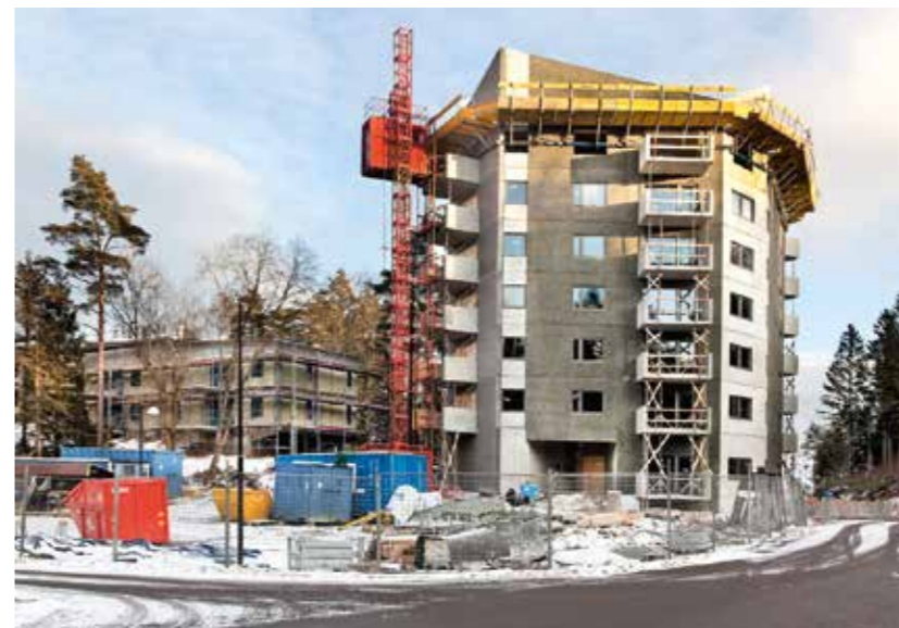
Kamhusen och Höjdpunkten.

Vi har blivit uppmärksammade på att dörrförsäljare av telefonabonnemang och andra saker påstår sig vara utsända av oss. Detta stämmer inte, ställer oss aldrig bakom några enskilda leverantörer på det viset.