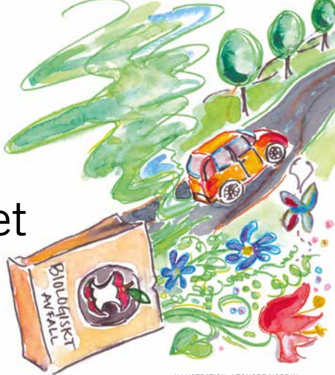
ILLUSTRATION: LEONORE NORDIN