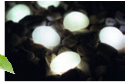
Lysande småstenar från Gelia. Ett set på tio stycken led-lampor med transformator kostar cirka 470 kronor.