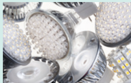
Led-belysning sparar både energi och miljö.