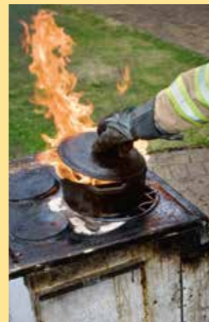
Bilden till vänster visar vad som händer när man försöker släcka en kastrull med överhettad olja med vatten. Använd i stället locket för att kväva lågorna, eller täck över med exempelvis en brandfilt.