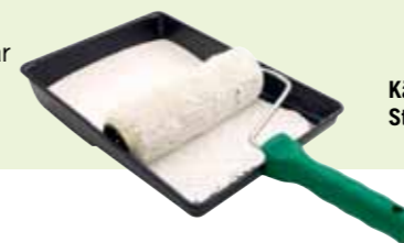
Källargången på Hindås Stationsväg är nymålade.

Katter är ett mysigt husdjur, men det är viktigt att man har lite uppsikt över dem. Som ägare till ett husdjur har man skyldighet att ha tillsyn så att inga olägenheter uppstår, att den gör sina behov i sandlådan eller liknande.