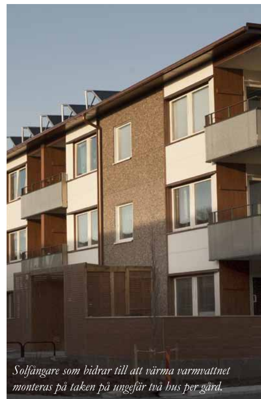
Solfångare som bidrar till att värma varmvattnet monteras på taken på ungefär två bus per gård.

Preliminär byggstart för etapp 4 är augusti 2011 och då kan arbetena i så fall vara klara till sommaren 2012. Etapp 5 sker ett år senare, alltså start augusti 2012. Etapp 4 omfattar Ekgården, underhåll på Säterigården samt Grangården 38-49. Etapp 5 omfattar resterande adresser på Grangården.