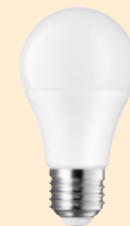
LED Även kallad lysdiodlampa