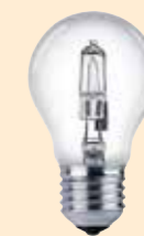
Halogen Flera socklar fasas ut av miljöskäl