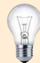
Glödlampa Fasas ut av miljöskäl