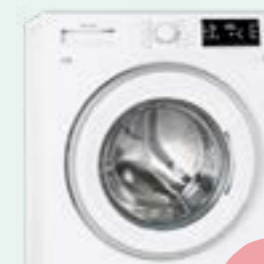
Tvätt/torkmaskin Cylinda FTTK 5685

Hemma hos dig är det du som bestämmer. Därför finns det stora möjligheter hos Förbo att skapa ett personligt hem, och du kan själv påverka lägenhetens inredning och ekonomi. Vi kallar tillvalskonceptet Personliga hem. För att du ska få stor valfrihet kan du göra många olika tillval i din lägenhet. Till exempel skaffa en kombinerad tvätt- och torkmaskin, sätta in en extra tyst diskmaskin eller byta till en ny kyl med rostfri dörr.