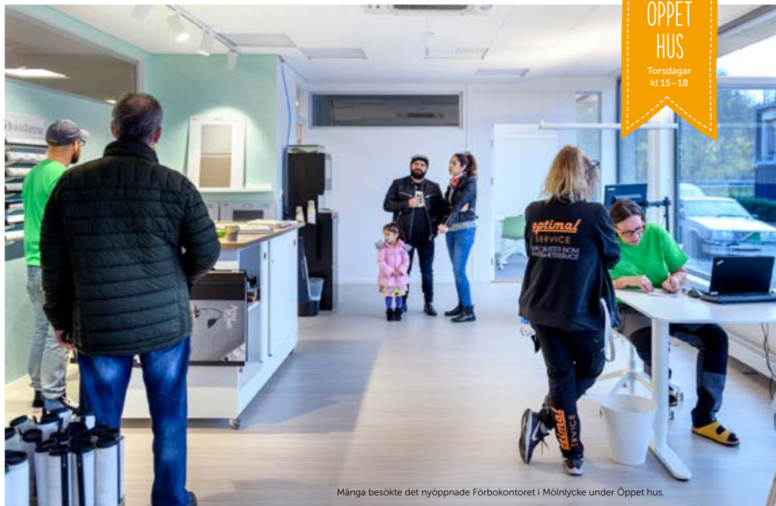
Många besökte det nyöppnade Förbokontoret i Mölnlycke under Öppet hus.

P å Mina sidor, via dator eller mobil, kan du när det passar dig bäst bland annat boka tvättstuguetid, söka p-plats, se dina hyresavier eller göra en serviceanmälan. Här ser du sedan vilken status ditt ärende har. Från att det tas emot, när serviceordern skickas och när material beställs – till att jobbet är utfört och klart.