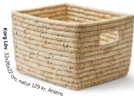
Korg Löv, 35x26x22 cm, natur 129 kr, Ahléns

» Visste du att... en bra temperatur i kylskåpet är max 5°C. Har du högre, runt 8°C, så trivs genast vissa bakterier och produkter som grönsaker ruttnar fortare.