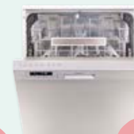
Diskmaskin rostfri Cylinda DM 3038 RF