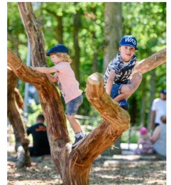
Ivar och Millton tyckte att klätterträdet och de andra naturliga lekredskapen, där barnen får utmana sig själva, var extra roliga.