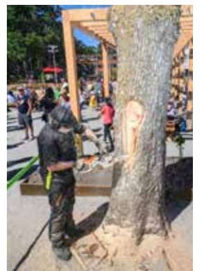
Motorsågskonstnären Björn skapar skalbaggar och fantasifigurer i en stubbe.