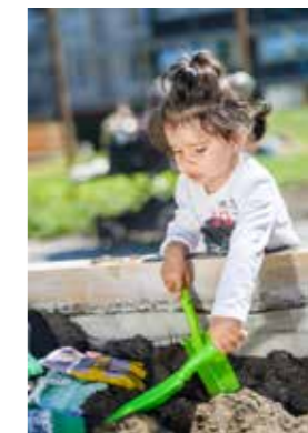
Vid odlingslådorna såddes frön och de som ville fick också ta med en kruka hem.