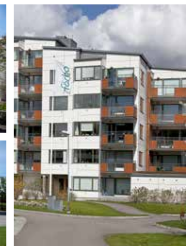
Sommarjobbarna kommer måla, städa och göra fint i området.

Förutom de ensamkommande flyktingbarnen kommer också två av Förbos sommarjobbare från i fjol att göra comeback i sommar. En av