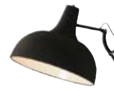
Golvampa CHINA, Jotex, 1 499 kr.