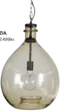
Taklampa SPEZIA, ByOn Design, 2 499kr.

Ljuslyktor och levande ljus ger fin mysbelysning.