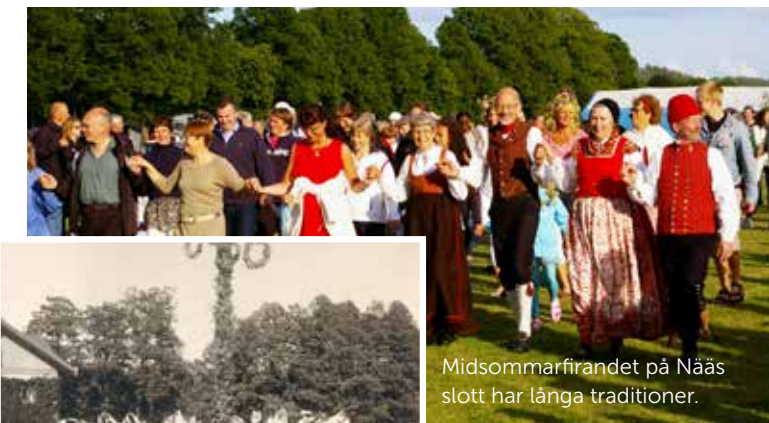
Midsommarfirandet på Näås slott har långa traditioner.

– Det är en fin upplevelse att se alla människor med olika bakgrunder som samlas här vid vackra