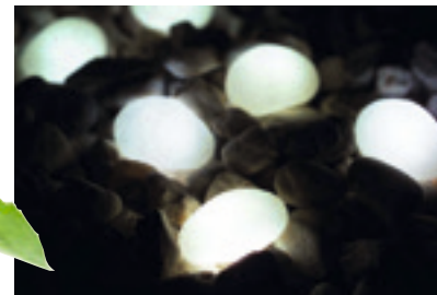
Lysande småstenar från Gelia. Ett set på tio stycken led-lampor med transformator kostar cirka 470 kronor.