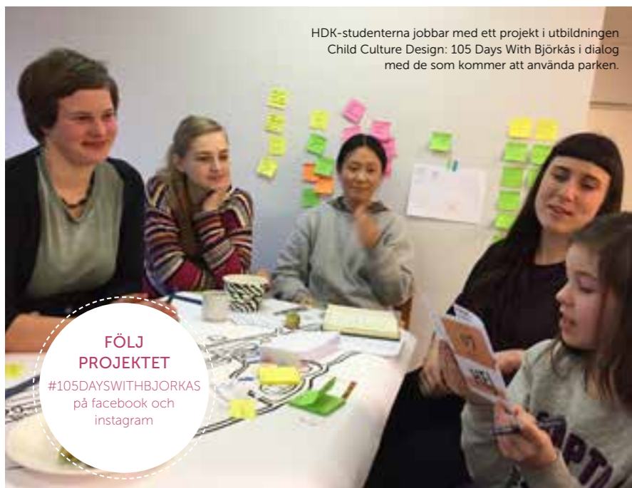
HDK-studenterna jobbar med ett projekt i utbildningen Child Culture Design: 105 Days With Björkås i dialog med de som kommer att använda parken.