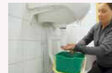
3. Skruva loss de delar under vattenlåset som håller fast rören – det kommer att rinna ut lite vatten.