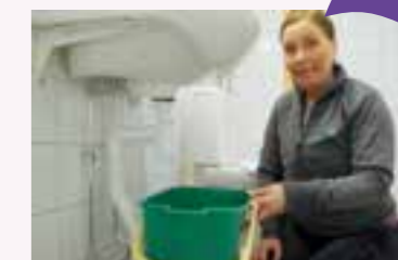
2. Förbered med en hink under tvättstället