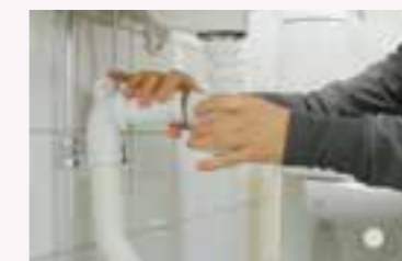
5. Skruva fast delarna.