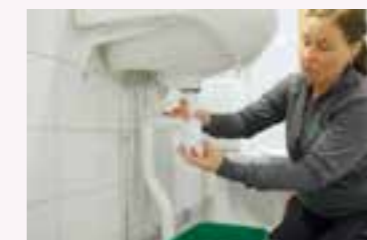
1. Se till att kranen är avstängd.