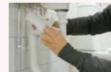
4. Rengör de delar du kommer åt, till exempel med papper. Avsluta med att spola vatten – se till att det inte läcker.