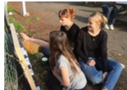
Under 105 dagar har arbetet med aktivitetsparken varit ett skolprojekt i utbildningen på Högskolan för Design och Konsthantverk.