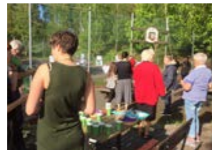
Vid den befintliga lekplatsen på Björkås visades förslag och en liten men entusiastisk skara hyresgäster var på plats.