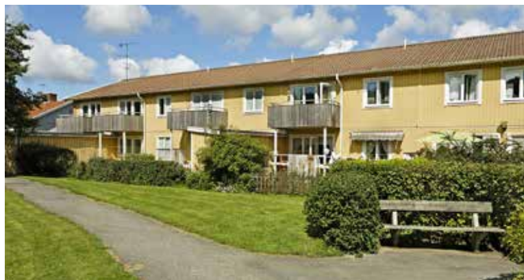
Det är en rabatt på Syrénvägen i Kungälv som nu åtgärdas efter synpunkter i Nöjd kund-undersökningen.

Utemiljön är ett område som hyresgästerna inte alltid är helt nöjda med och för förbovärdarna handlar det om att försöka förstå varför. Är det