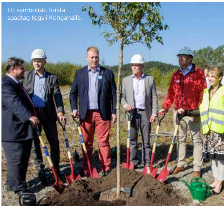
Ett symboliskt första spadtag togs i Kongahälla.

De första lägenheterna beräknas vara klara för inflyttning 2017, men stormarknaden ska öppna redan året innan.