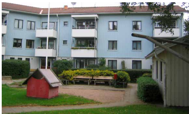
Lekplatsen på Körsbärgsgatan får en ny lekstuga nästa år. Det kommer också bland annat bli en ny parkeringsplats i området.