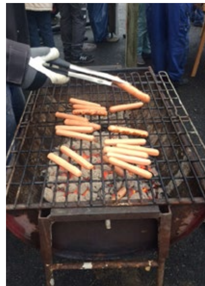
Den gemensamma fixardagen på Stommen avslutades med korvgrillning.

i området på kvällstid. Att kunna träffas så här grannar emellan och lära känna