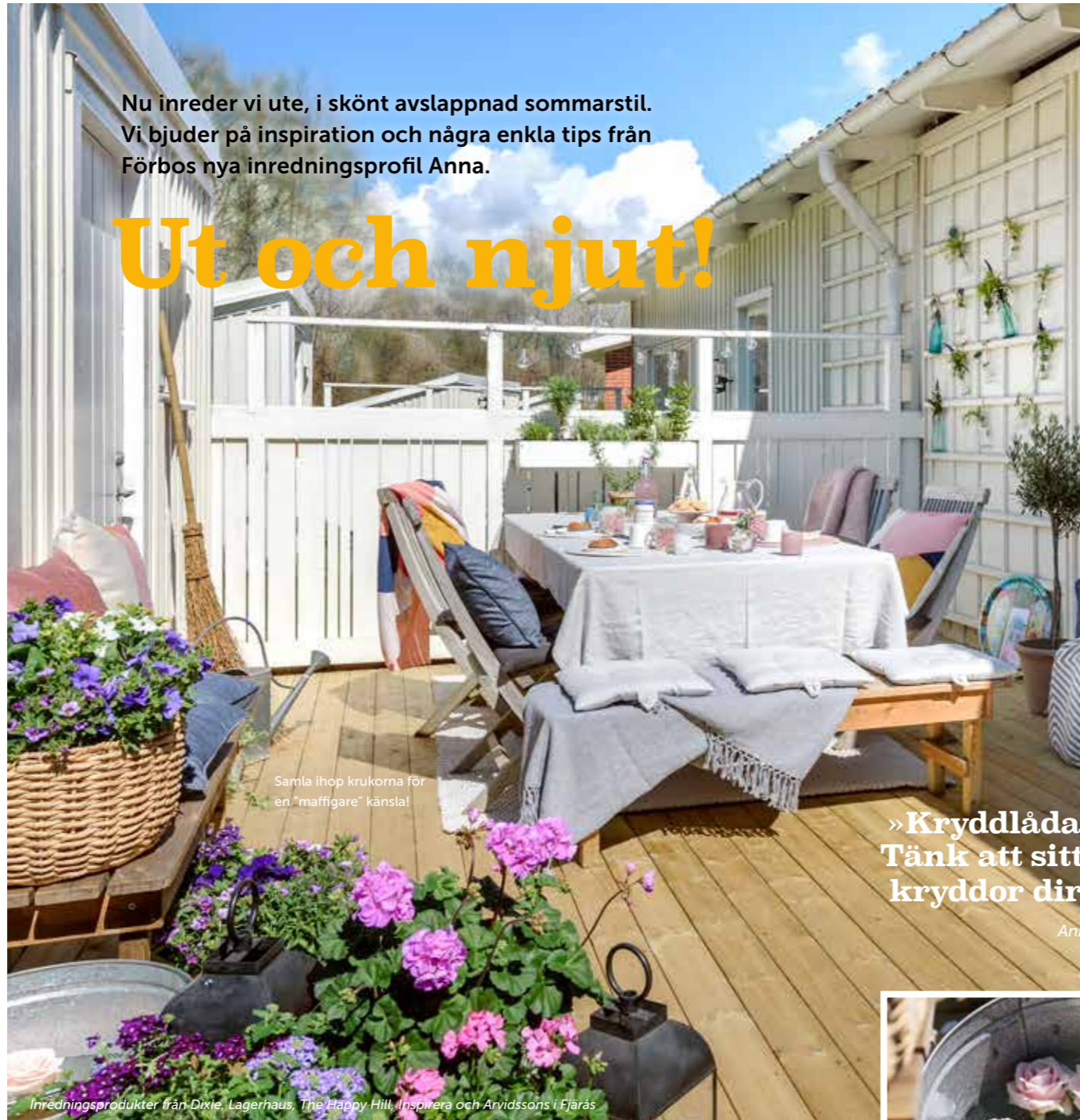
Samla ihop krukningarna för en "maffigare" känsla!