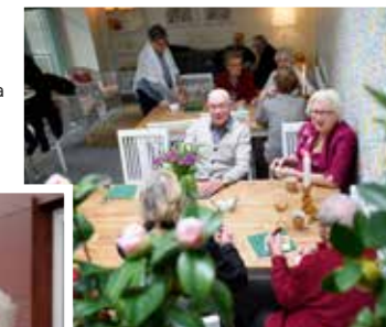
▲ God stämning och många samtal bådär gott för framtiden i Orangeriet.