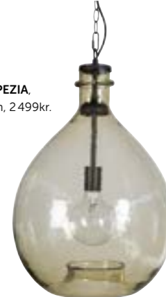
Taklampa SPEZIA, ByOn Design, 2 499kr.

Ljuslyktor och levande ljus ger fin mysbelysning.