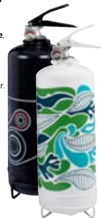
Brandsläckare , för mindre utrymmen. Pulver, 2 kg. Biltema, 199 kr.