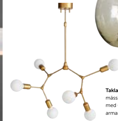
Taklampa FLOREAN av mässingsfärgad metall med 6 delvis justerbara armar. Ellos, 1799 kr.