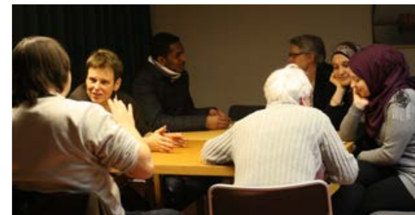
▲ Ett språkcafé handlar om så mycket mer än att bara öva på språket.

Som en del i Lindomeprojektet arrangeras språkcafé på svenska. Lindomeprojektet sysslar med olika aktiviteter som ökar tryggheten och delaktigheten för boende i Lindome. Caféet är dock till för alla – oavsett var du bor.