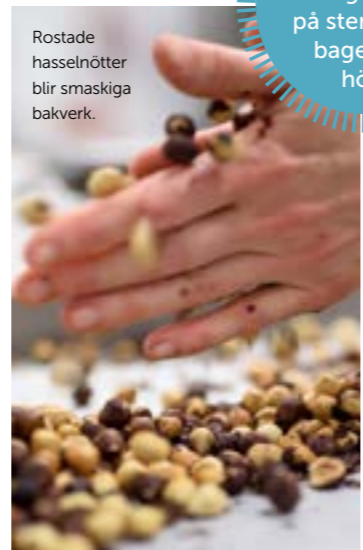
Rostade hasselnötter blir smaskiga bakverk.

Smörgåstårter på stenugnsbageriet i höst