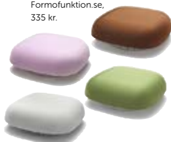
Brandvarnare Kupu , finsk design. Formofunktion.se, 335 kr.

Brandfilten släcker mindre bränder så som Kastrullbrand.