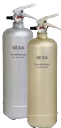
Brandsläckare , för mindre utrymmen. Pulver, 2 kg. Icahemma.se, 249 kr.