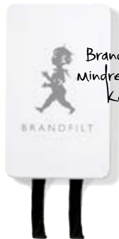
Solstickan Brandfilt , i stilfull ställåda. Royaldesign.se, 395 kr.

Brandfilten släcker mindre bränder så som Kastrullbrand.