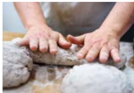
▲ Valnötsbröden bakas ut för att kalljasa under natten.

– Jag är alltid trött, men jag har aldrig haft en tråkig dag på jobbet! ■