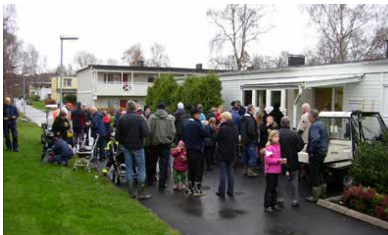
Den 8 november är alla hyresgäster välkomna ut för att göra det lilla extra för Stommen. Självklart finns det fika efter väl utfört arbete.

– Det blir en gemenskap i området när man träffas och städar och fikar tillsammans. Man lär