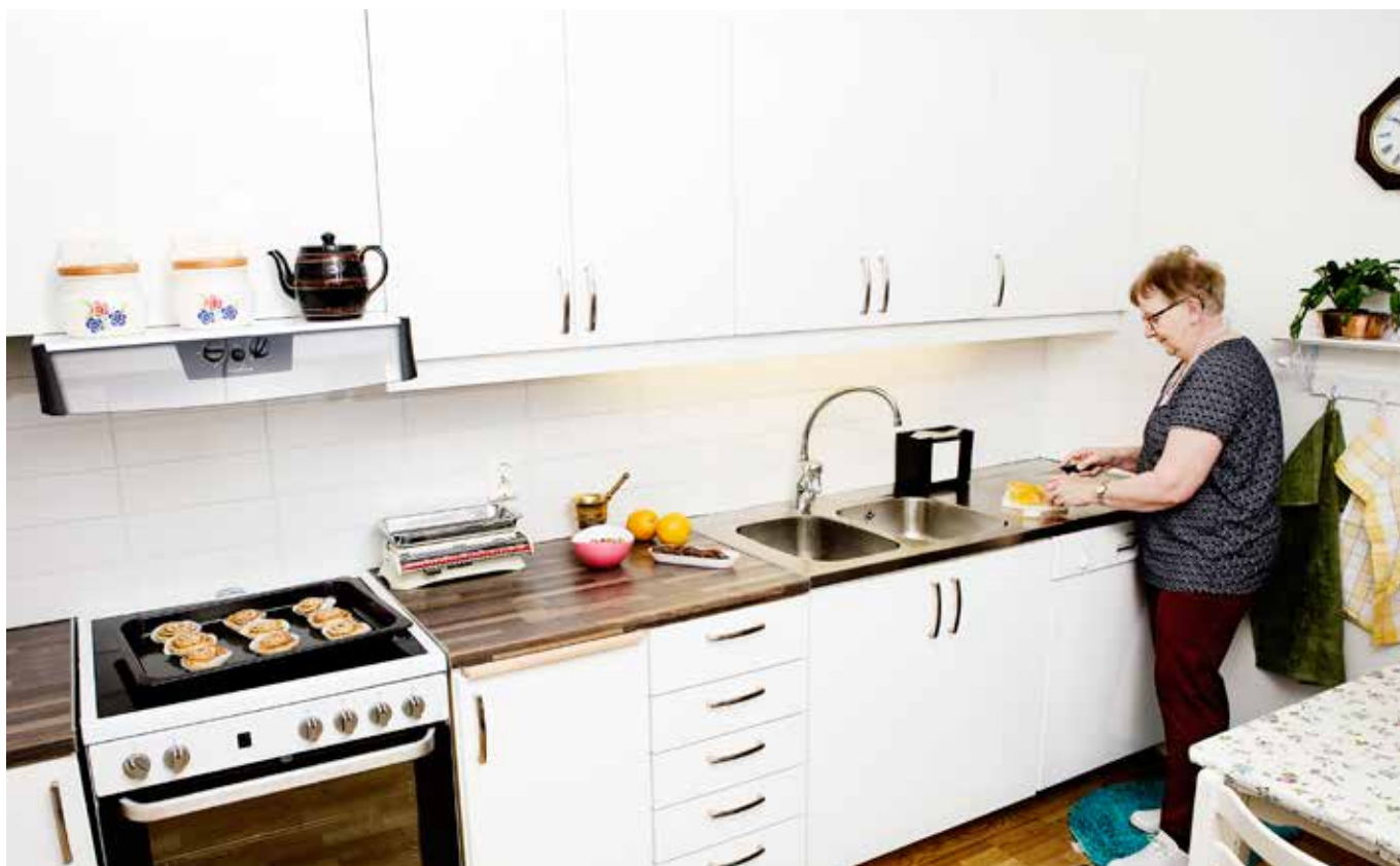
Maj-Lis har ser fram emot julstöket i sitt nya kök. Hon gillar den nya mörka bänkskivan, det långsmala kaklet och de högblanka skåpluckorna.