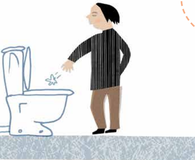
ILLUSTRATION: HELENA BERGENDAHL