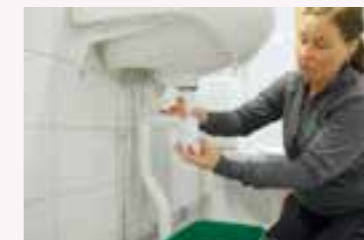
1. Se till att kranen är avstängd.