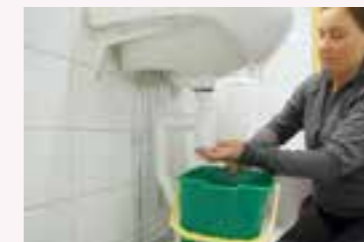
3. Skruva loss de delar under vattenlåset som håller fast rören – det kommer att rinna ut lite vatten.