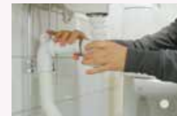
5. Skruva fast delarna.

NÄR? Rensa regelbundet, eller när du märker att vattnet rinner ner långsammare.