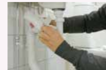
4. Rengör de delar du kommer åt, till exempel med papper. Avsluta med att spola vatten – se till att det inte läcker.