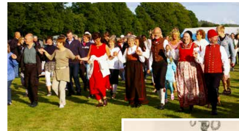
Midsommarfirandet på Näås slott har långa traditioner.

– Det är en fin upplevelse att se alla människor med olika bakgrunder som samlas här vid vackra