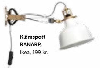
Klämspott RANARP, Ikea, 199 kr.