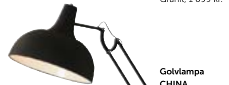
Golvampa CHINA, Jotex, 1 499 kr.