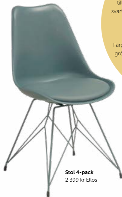
Stol 4-pack 2 399 kr Ellos

Färgskalan går i mustiga och dova färger som mossgrönt, brända orange toner, senapsgult, petrolblått, brunt eller kraftiga pasteller. Lägg gärna till geometriska mönster och tydliga kontraster. Mönstrade tapeter är ett måste!