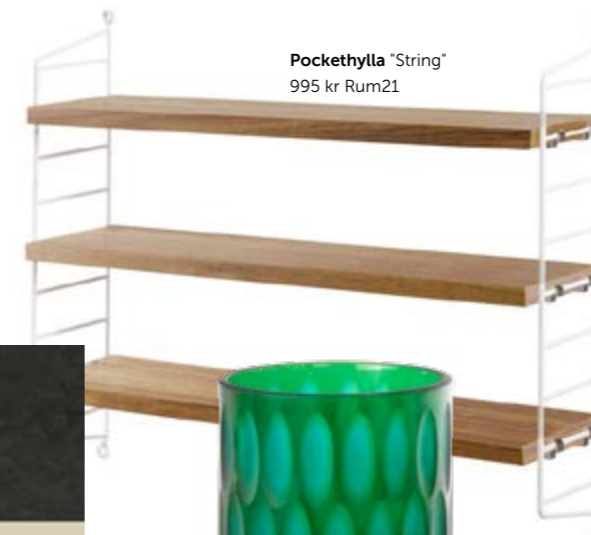
Pockethylla "String" 995 kr Rum21