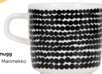
Kaffemugg 159 kr Marimekko