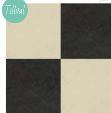
Marmoleum click, blackhole/moon