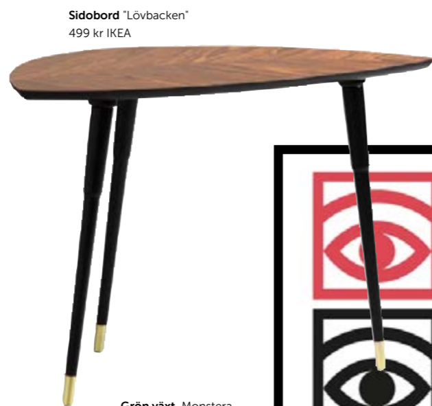
Sidobord "Lövbacken" 499 kr IKEA