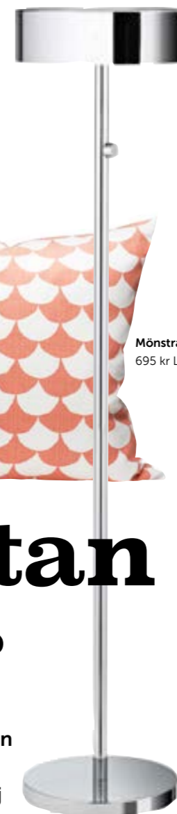
Golvampa "Stockholm" 699 kr IKEA