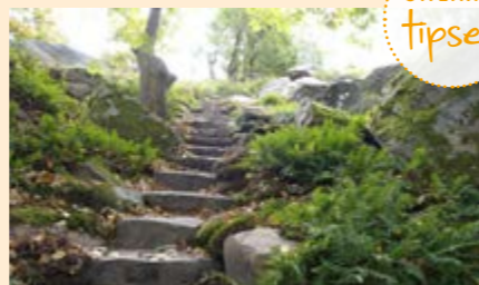
Ta en promenad och pausa med fika.