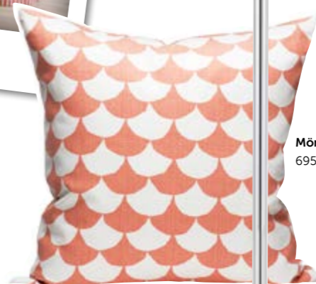
Mönstrad kudde 695 kr Littlephant