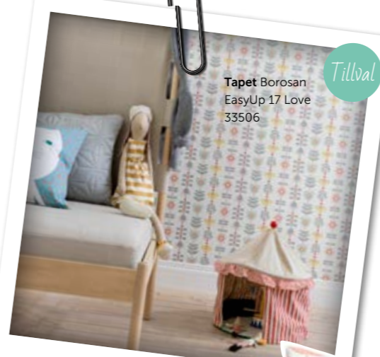
Tapet Borosan EasyUp 17 Love 33506