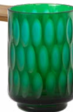
Grön vas 279 kr Jotex