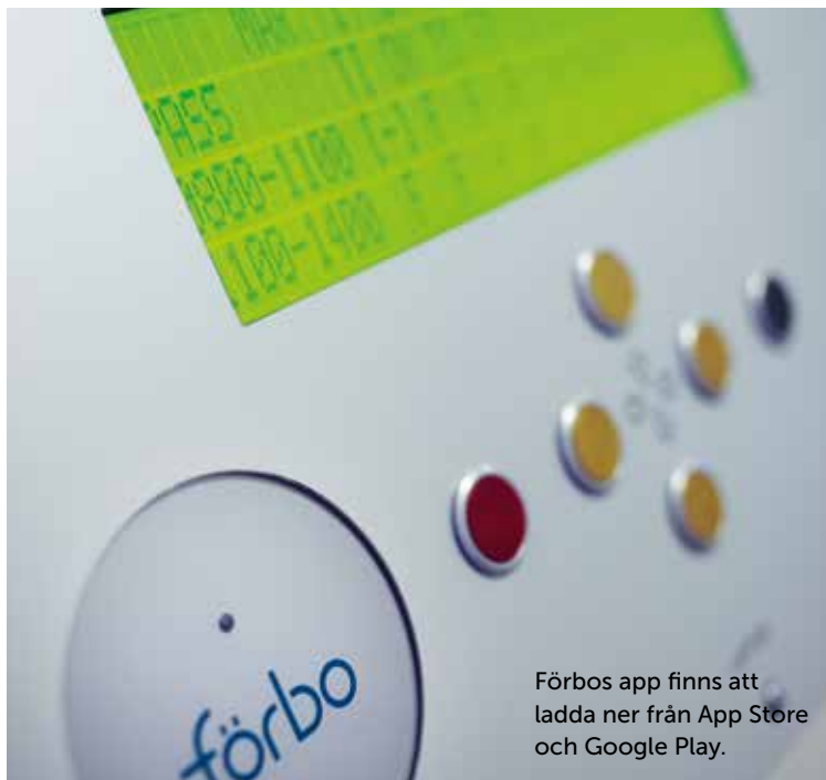
Förbos app finns att ladda ner från App Store och Google Play.