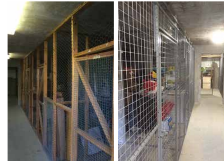
De nya källarförråden med stålgaller i stället för hönsnät är både säkrare och snyggare enligt förbovärd Florian Damgaard.

– Vi kommer att göra om några per år framöver. Det nya systemet med pulverlackerat metallgaller är både mer inbrottsäkert och snyggare än tidigare. Vi tycker det blev jättebra och