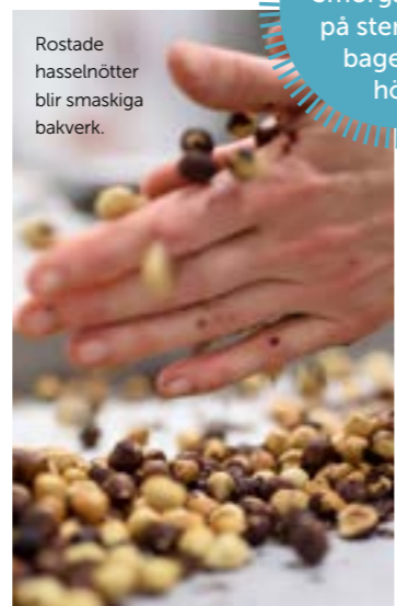
Rostade hasselnötter blir smaskiga bakverk.

Smörgåstårter på stenugnsbageriet i höst