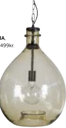
Taklampa SPEZIA, ByOn Design, 2 499kr.

Ljuslyktor och levande ljus ger fin mysbelysning.