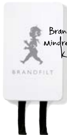
Solstickan Brandfilt , i stilfull ställåda. Royaldesign.se, 395 kr.

Brandfilten släcker mindre bränder så som Kastrullbrand.