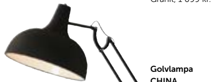
Golvampa CHINA, Jotex, 1 499 kr.