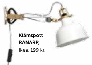
Klämspott RANARP, Ikea, 199 kr.