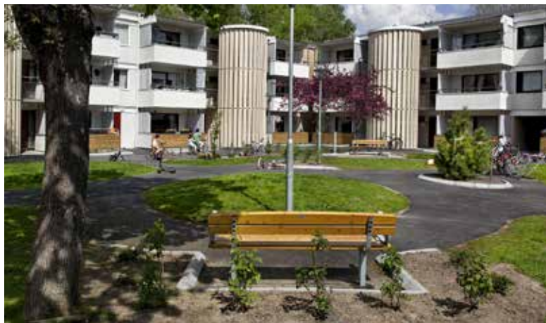
Trygghetsvandringarna går ibland genom Förbos områden, som detta vid Lindome centrum.