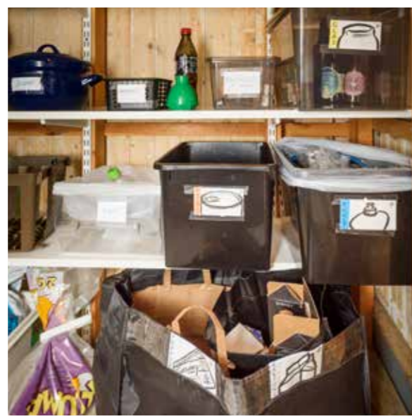
Gill föredrar att sätta tunna plastpåsar i lådorna, för att undvika kladd och spill. Tratten är till för att hålla matfett i petflaskor, som sedan slängs på kommunens återvinningsstation.

– Förbo kanske kan genomföra temadagar eller föreläsningar på temat?