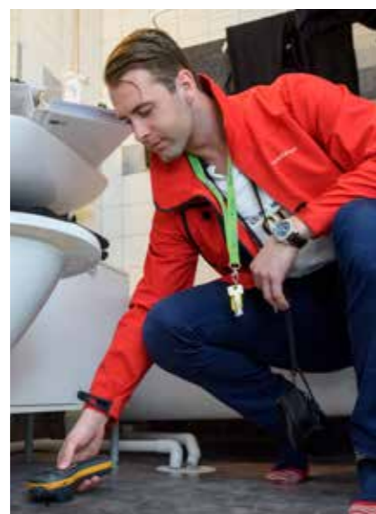
Bland annat tas fuktprov och avloppsrör filmas.