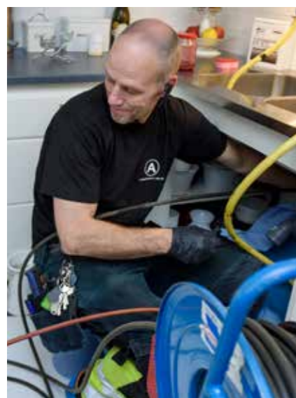
Inne i lägenheterna undersöks kök och badrum.

Löpande underhåll och reparationer pågår parallellt och det akuta tar vi hand om direkt, som vanligt.