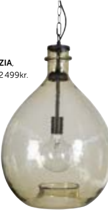
Taklampa SPEZIA, ByOn Design, 2 499kr.

Ljuslyktor och levande ljus ger fin mysbelysning.