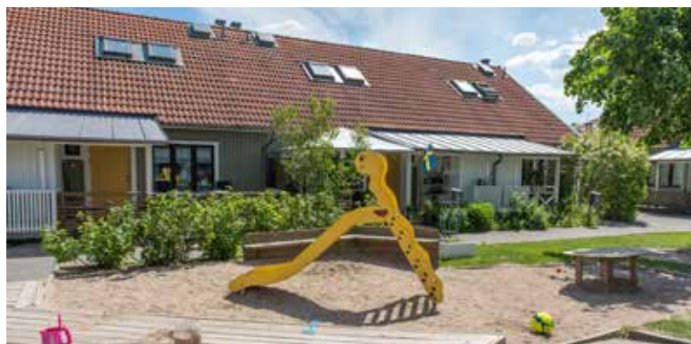
Utemiljön på Skogsglantan har fått en rejäl uppträskning.

– Färgskalan har lugnats ner. Fasader, gårdar och garage har fått milda nyanser av framför allt gult, grönt och rött och alla fönsterfoder har fått