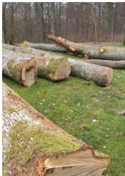
Några av ekarna som fällts och som ska åter användas i aktivitetsparken.

Bygget påbörjas till hösten och det kommer att finnas aktuell information på plats om vad som är på gång. Nästa sommar blir det invigning, men redan till vintern kan det vara klart för lek i vissa delar av den nya parken.