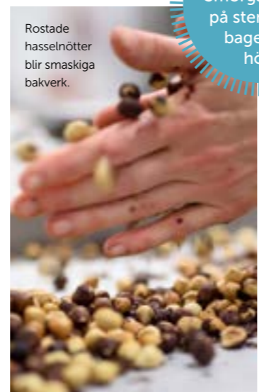
Rostade hasselnötter blir smaskiga bakverk.

Smörgåstårter på stenugnsbageriet i höst