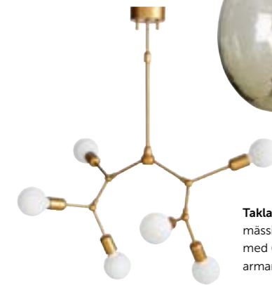
Taklampa FLOREAN av mässingsfärgad metall med 6 delvis justerbara armar. Ellos, 1799 kr.