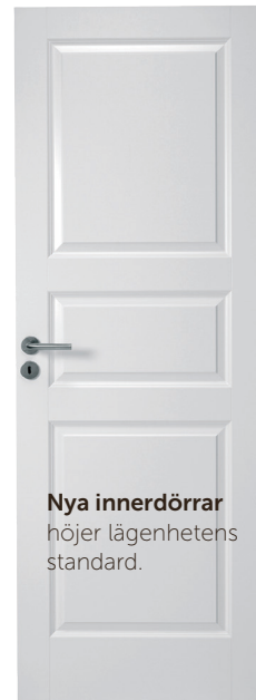
Nya innerdörrar höjer lägenhetens standard.