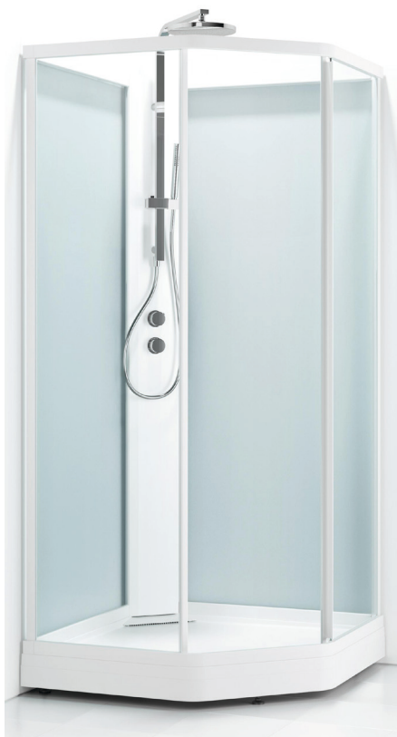
Duschkabin från Svedbergs med två duschalternativ.