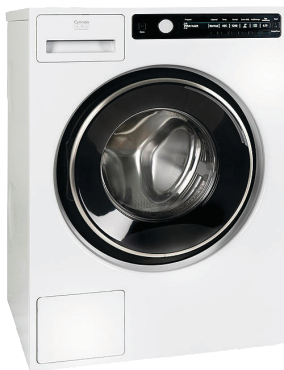
Tvättmaskin från Cylinda, hela 18 program med en mängd olika tillval per program.

Förenkla vardagen med lättskötta tillval. Vi har duschväggar, duschkabin, tvättmaskiner, torktumlare och handduktork och som ger badrummet ett lyft.