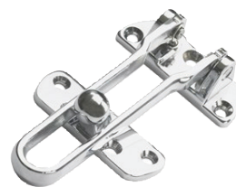
Dörrspärr/bygel med tre fasta lägen.