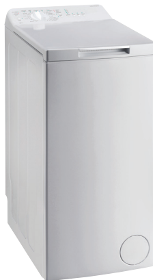
Toppmatad tvättmaskin för det mindre badrummet.