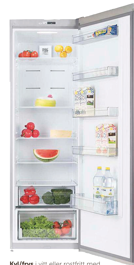
Kyl/frys i vitt eller rostfritt med automatisk avfrostning från Cylinda.