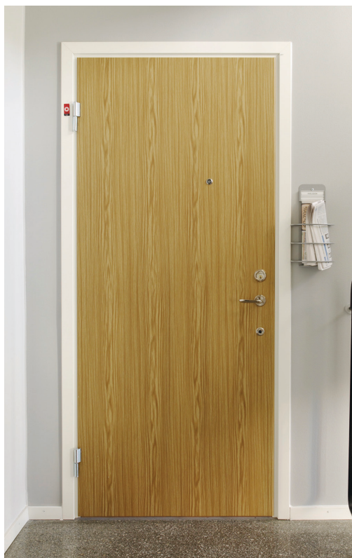
Säkerhetsdörr för loftgång/trappuppgång från Daloc ger extra skydd vid brand och dämpar ljud.

Ibland kan det kännas skönt att kunna kika ut när det ringer på dörren, utan att öppna först, eller att ha ett extralås för ytterdörren. Därför har vi tillval som ökar säkerheten och din trygghet. Vi har även garderobsdörrar och innerdörrar.