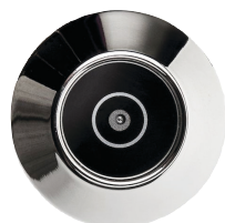
Dörröga är en trygghet att ha när det ringer på dörren.