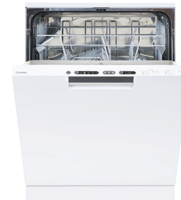
Diskmaskin i vitt eller rostfritt från Cylinda.