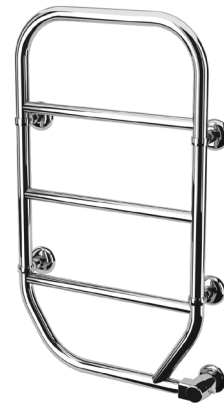
Handduktorken Nila i klassisk design.