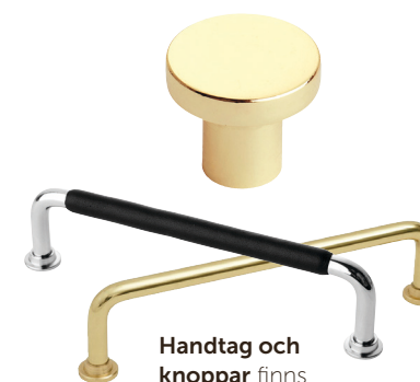
Handtag och knoppar finns i olika färger och stilar.