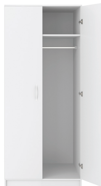
Garderobsdörrar finns i tre olika utföranden.