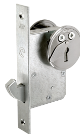
Niotillhållarlås ett säkert extralås för ytterdörren.