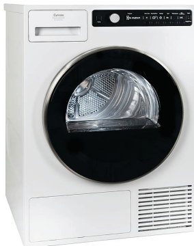
Torktumlare från Cylinda med 9 olika program, bland annat snabb-, tids- och luftningsprogram.