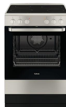
Spis och varmluftsugn från Cylinda, finns med keramik- eller induktionshäll.