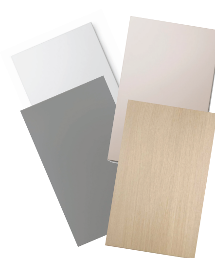
Köksluckor i olika färger, till exempel snövit, pärlgrå och lindblomsgrön.

Piffa upp hemmets hjärta! Genom att byta köksluckor, sätta in ny bänkskiva och ny spis blir matlagningen så mycket roligare. Se alla kökstillval på forbo.se .