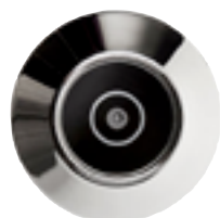
Dörröga är en trygghet att ha när det ringer på dörren.