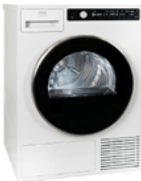
Torktumlare från Cylinda med 9 olika program, bland annat snabb-, tids- och luftningsprogram.