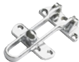
Dörrspärr/bygel med tre fasta lägen.