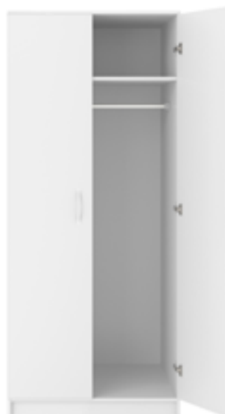
Garderobsdörrar finns i tre olika utföranden.