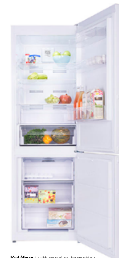
Kyl/frys i vitt med automatisk avfrostning från Cylinda.