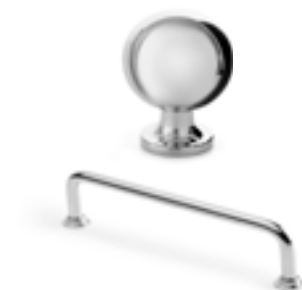
Handtag och knoppar finns i olika färger och stilar.