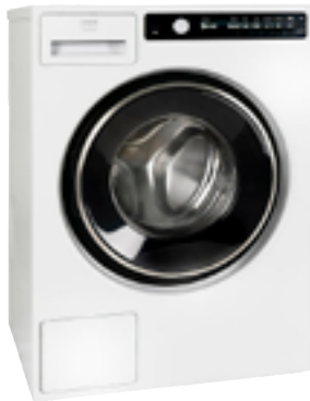
Tvättmaskin från Cylinda, hela 18 program med en mängd olika tillval per program.

Förenkla vardagen med lättskötta tillval. Vi har duschväggar, duschkabin, tvättmaskiner, torktumlare och kombimaskin som ger badrummet ett lyft.