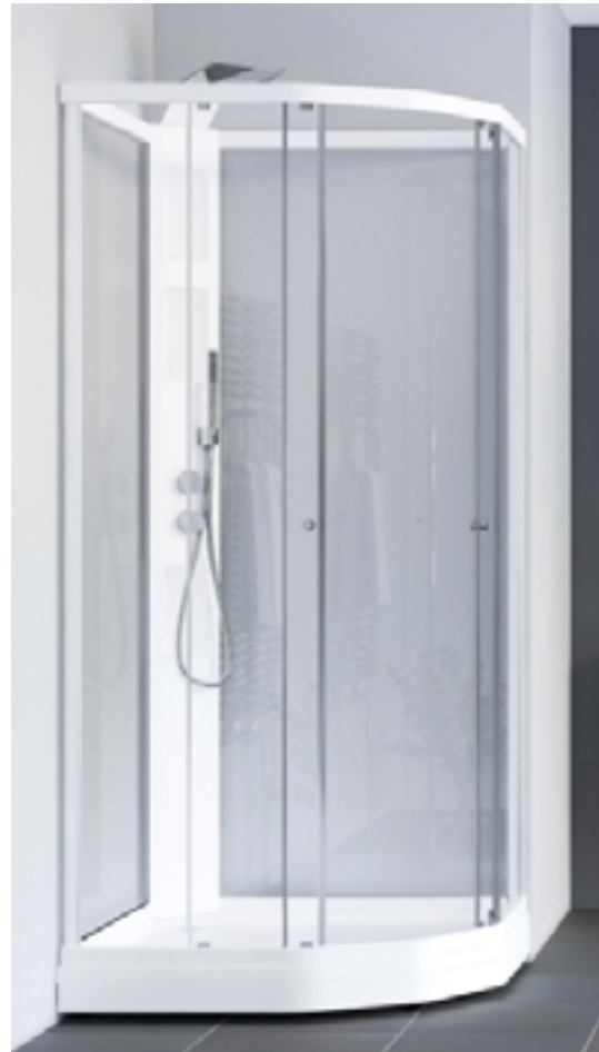
Duschkabin från Svedbergs med två duschalternativ.