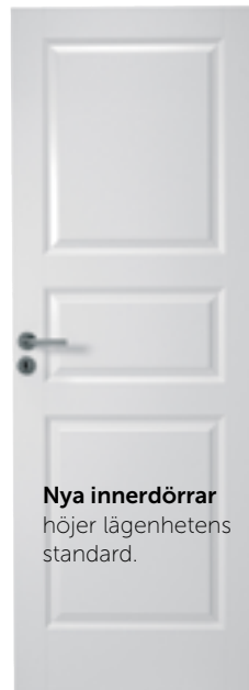
Nya innerdörrar höjer lägenhetens standard.