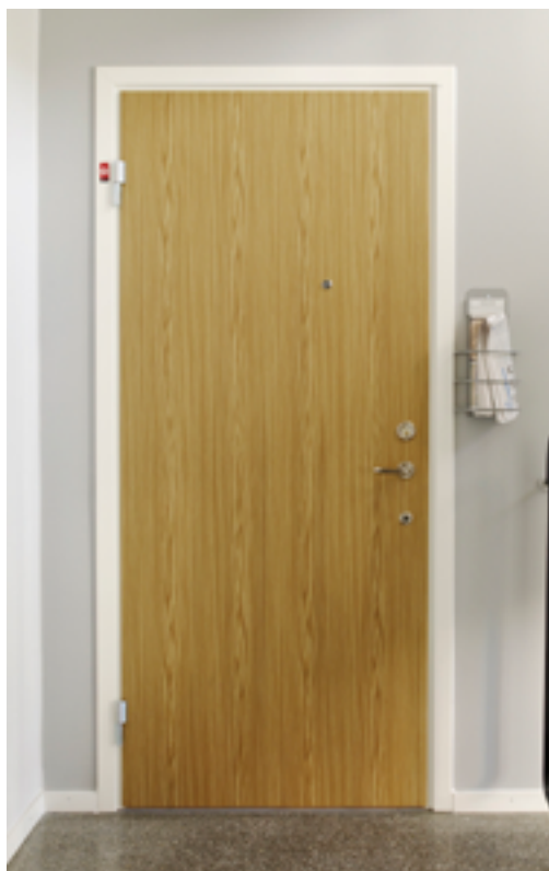
Säkerhetsdörr för loftgång/trappuppgång från Daloc ger extra skydd vid brand och dämpar ljud.

Ibland kan det kännas skönt att kunna kika ut när det ringer på dörren, utan att öppna först, eller att ha ett extralås för ytterdörren. Därför har vi tillval som ökar säkerheten och din trygghet. Vi har även garderobsdörrar och innerdörrar.