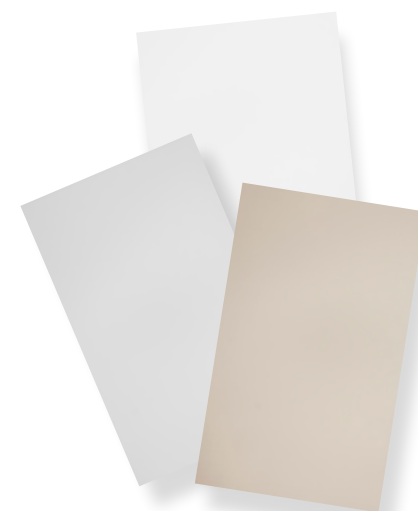
Köksluckor i olika färger, till exempel snövit, pärlgrå och barista beige.

Piffa upp hemmets hjärta! Genom att byta köksluckor, sätta in ny bänkskiva och ny spis blir matlagningen så mycket roligare. Se alla kökstillval på forbo.se .