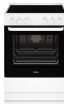
Spis och varmluftsugn från Cylinda, finns med keramik- eller induktionshäll.