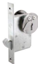
Niotillhållarlås ett säkert extralås för ytterdörren.