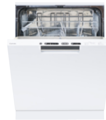
Diskmaskin från Cylinda.