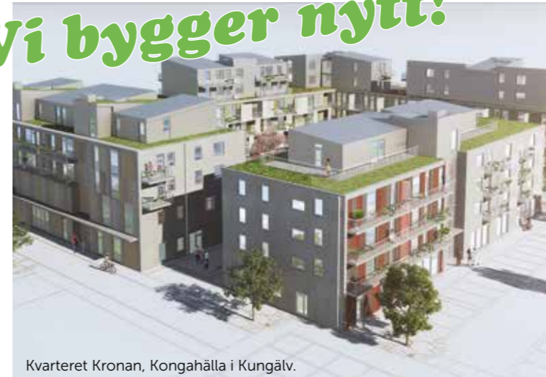
Kvarteret Kronan, Kongahälla i Kungälv.