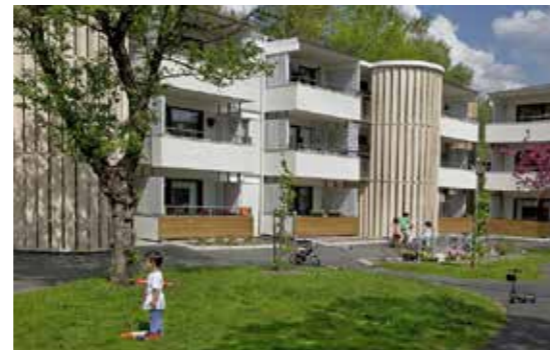
Smörkullegården i Lindome ligger centralt nära affärer och kollektivtrafik. Det är ett av de områden som byggdes på 1970-talet, med funktionella och praktiska lägenheter.