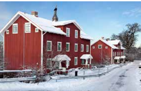
Tollered i Lerum är en av Sveriges bäst bevarade bruksorter. I samhället har 94 hus skyltar som berättar om ortens historia. Förbo har hyresrätter i flera av fastigheterna.